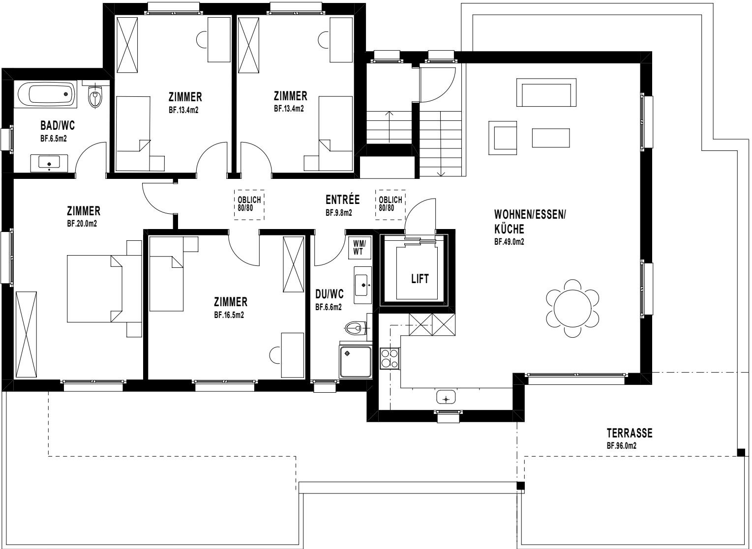
WOHNUNG 5 5 1/2 ZIMMER

ATTIKAGESCHOSS MFH BÜELSTRASSE 8 8192 GLATTFELDEN 1:100